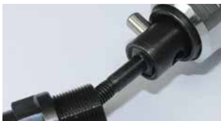
Schnellwechselsystem für Gewindedorn.

Komfortables Abspindeln durch leichtgängigen Drillstab