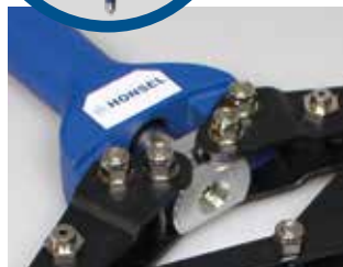
Wechselmundstücke im Werkzeug verschraubt.