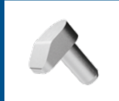
Bolzen und Hülsen