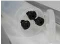
Wechselmundstücke in verschlossenem Fach am Stiftaufangbehälter