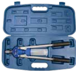
Hebelnietgerät BZ 70 im schlagfesten Kunststoff-Koffer.