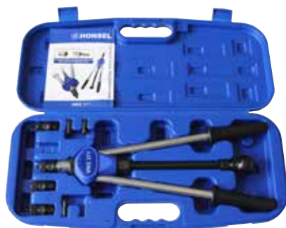
Lieferung im schlagfesten Kunststoff-Koffer.